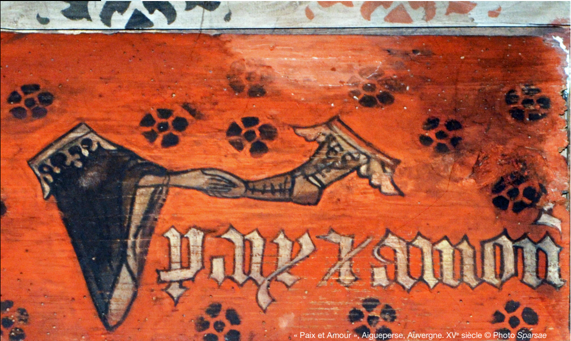
« Paix et Amour », Aigueperse, Auvergne, XV e siècle